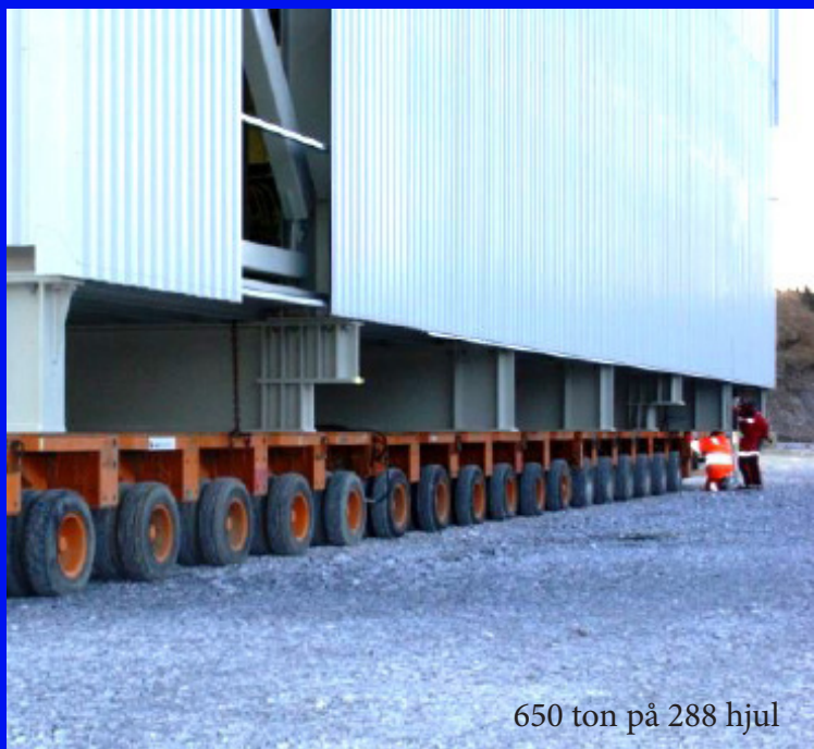
650 ton på 288 hjul

Projektet var unikt för oss, inte enbart på grund av dess storlek utan på sättet det genomfördes. Det byggdes 500 meter från platsen där allt installerades vilket innebar att gruvverksamheten pågick som vanligt, med minimalt driftsstopp. Montagetiden var 7 månader.