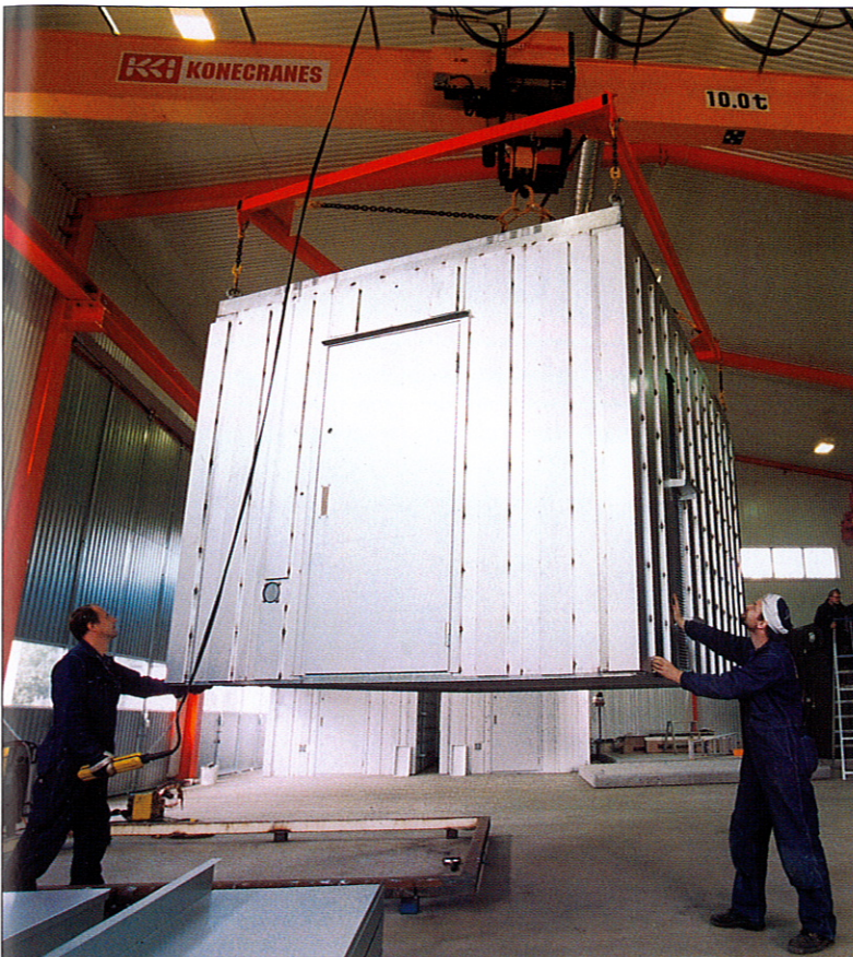
Klart för leverans till Tele Danmark! Behovet av den här typen av teknikhus är stort. Utbyggnaden av olika mobilnät, bredband etc leder till det. Stål & Rörmontage har byggt en separat produktionshall för tillverkning av teknikhus.