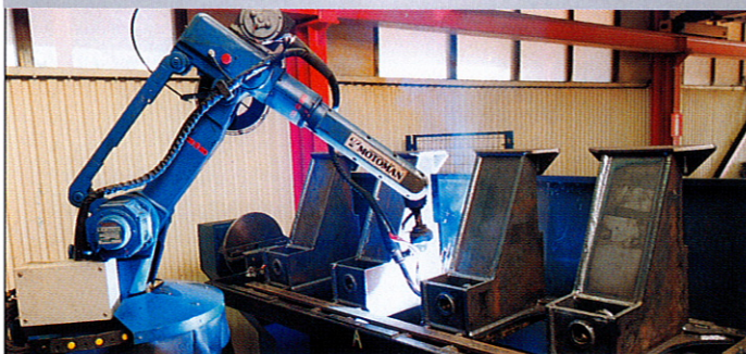
Svetsroboten "Roberta" tar hand om svetsarbeten i längre serier. Svetsaren har därmed blivit "programmerare".

Stål & Rörmontage har investerat i en svetsrobot som tar hand om svetsarbeten i lite längre serier.