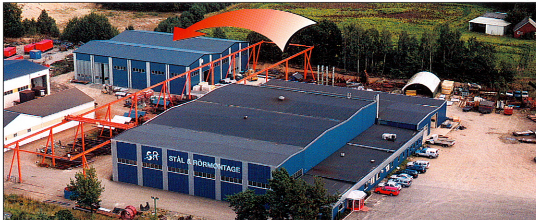
Stål & Rörmontage har byggt en ny montagehall på 650 m 2 där teknikhusen görs helt "inflyttningsklara" för Tele Danmark, som sedan själva monterar in sina växlar. Totalt har Stål & Rörmontage nu moderna lokaler på 4500 m 2 . I de välutrustade verkstäderna finns bl a 12 traverser, 5 - 15 ton med lyfthöjd upp till 8 meter. Stål & Rörmontage ligger alldeles intill E22 mellan Sölvesborg och Karlshamn.

– Vi såg direkt vilka möjligheter och resurser Stål & Rörmontage har som samarbetspartner för vår del, säger Patrik Persson. Här finns resurser, kompetens och ett flexibelt, utvecklingsvänligt synsätt.